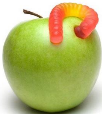
Żelkowy "robaczek" w jabłku