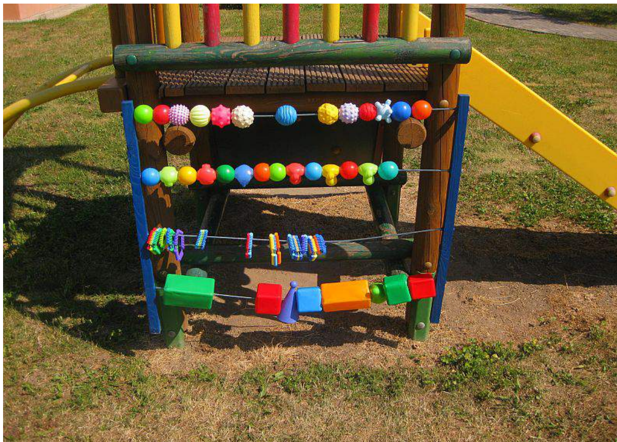
Drabinka manipulacyjna-zmysł dotyku i wzroku