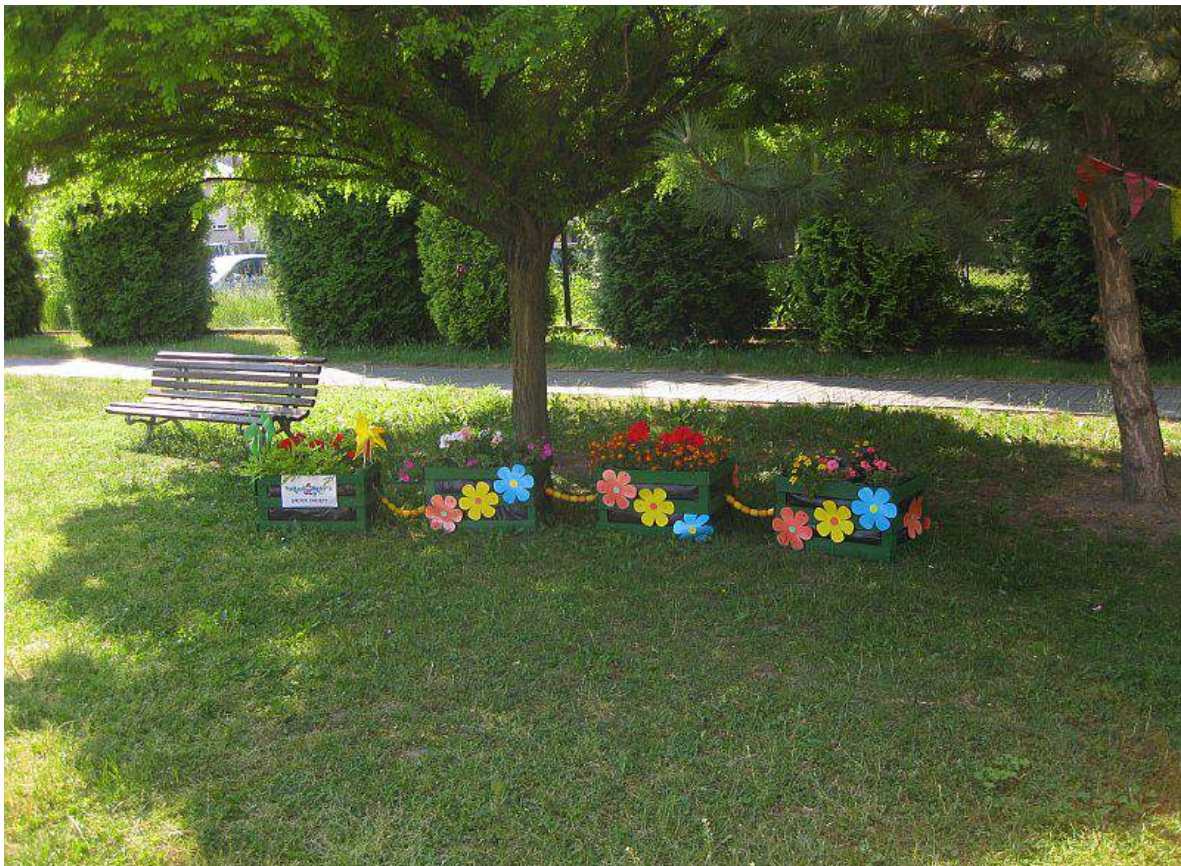
„Kwiecisty pociąg”-zmysł wzroku i węchu