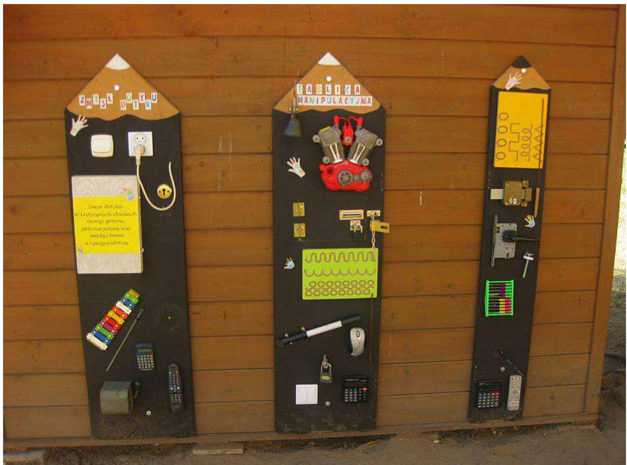
Tablice manipulacyjne-zmysł dotyku i słuchu