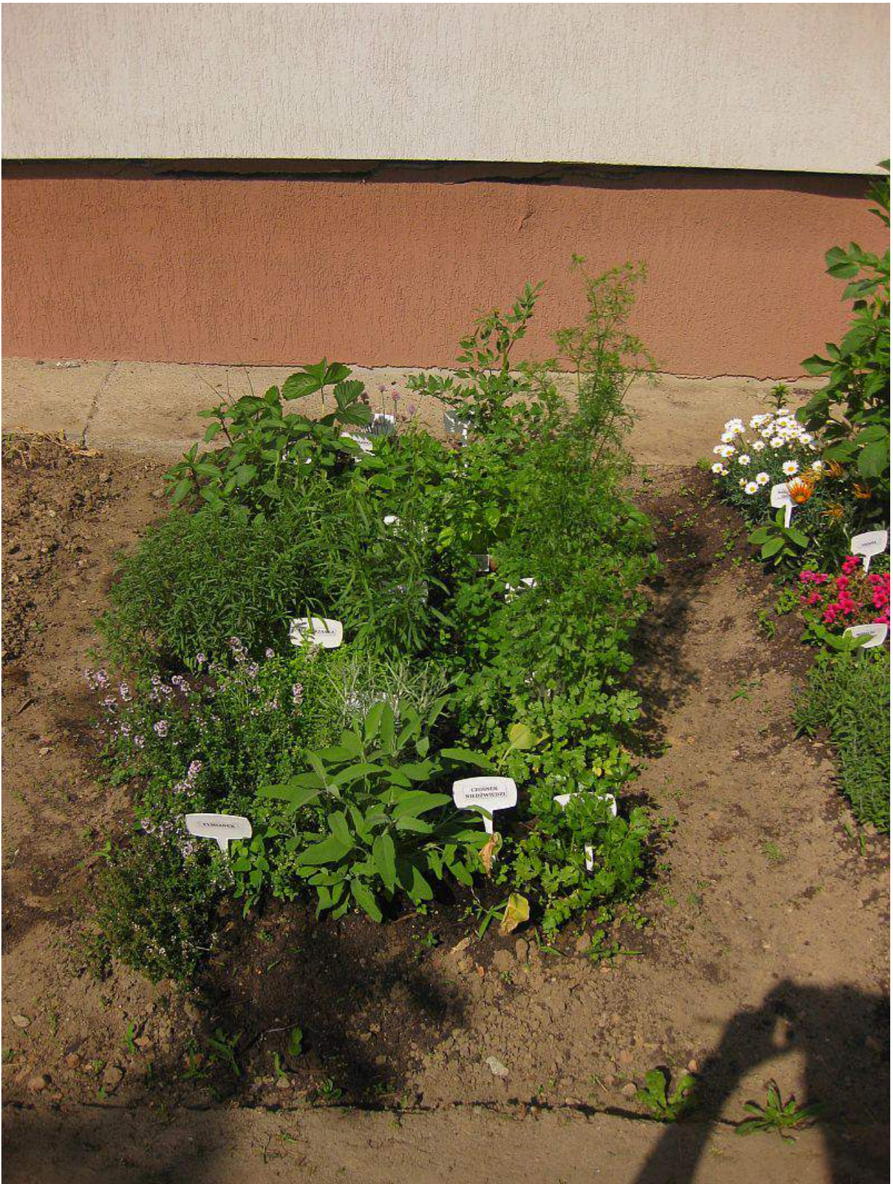
„Ziółowy zakątek”- zmysł węchu i smaku