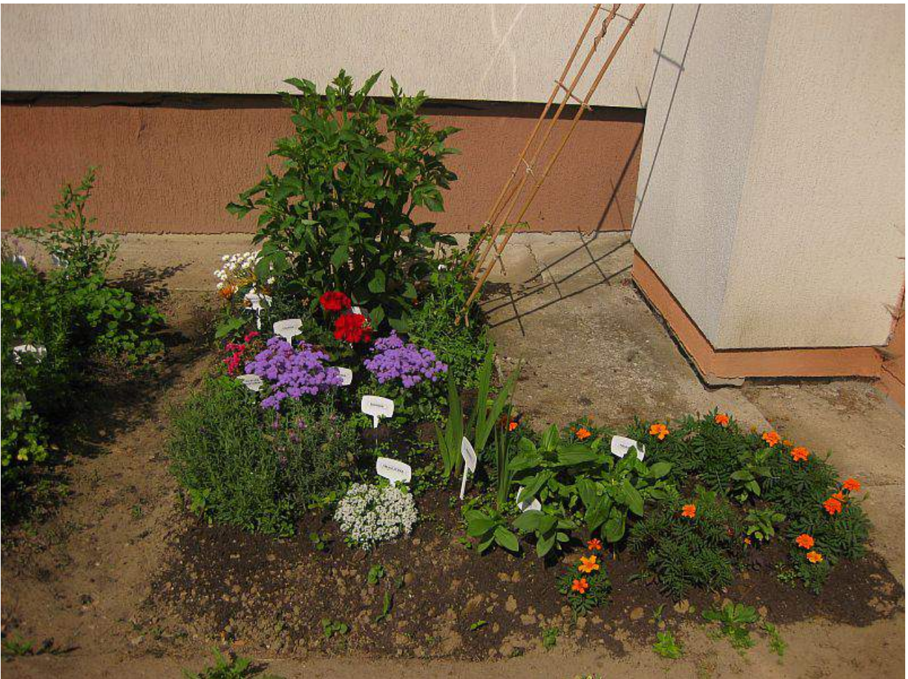
„Kwiatowa rabatka”- zmysł wzroku i węchu

Dla przedszkolaków to świetna zabawa integrująca poprawną pracę zmysłów: dotyku,węchu,słuchu,wzroku ,smaku oraz zmysłu równowagi. Dzięki sensorycznej atrakcji dzieci rozwijają kreatywność i zainteresowanie otaczającym światem.