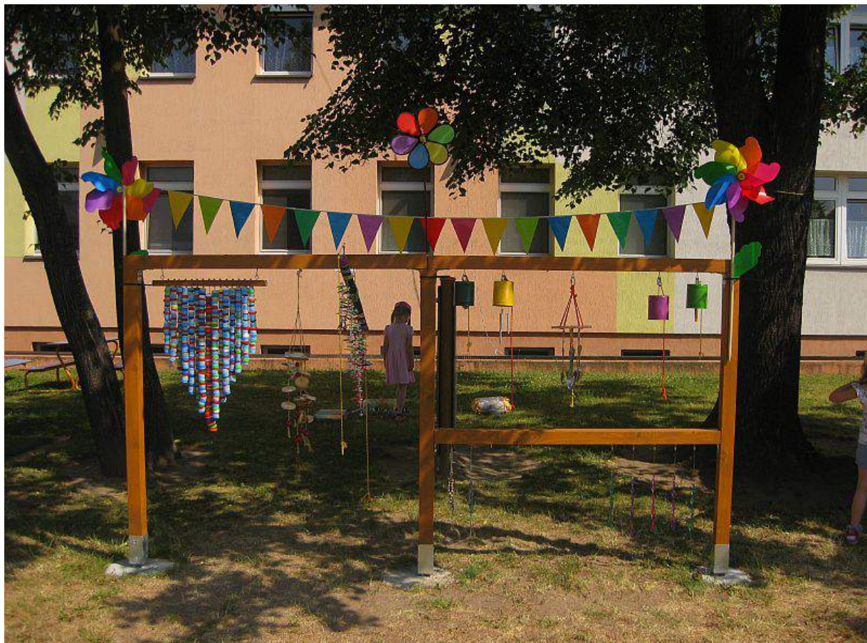
„Kącik dźwięków”-zmysł słuchu i wzroku