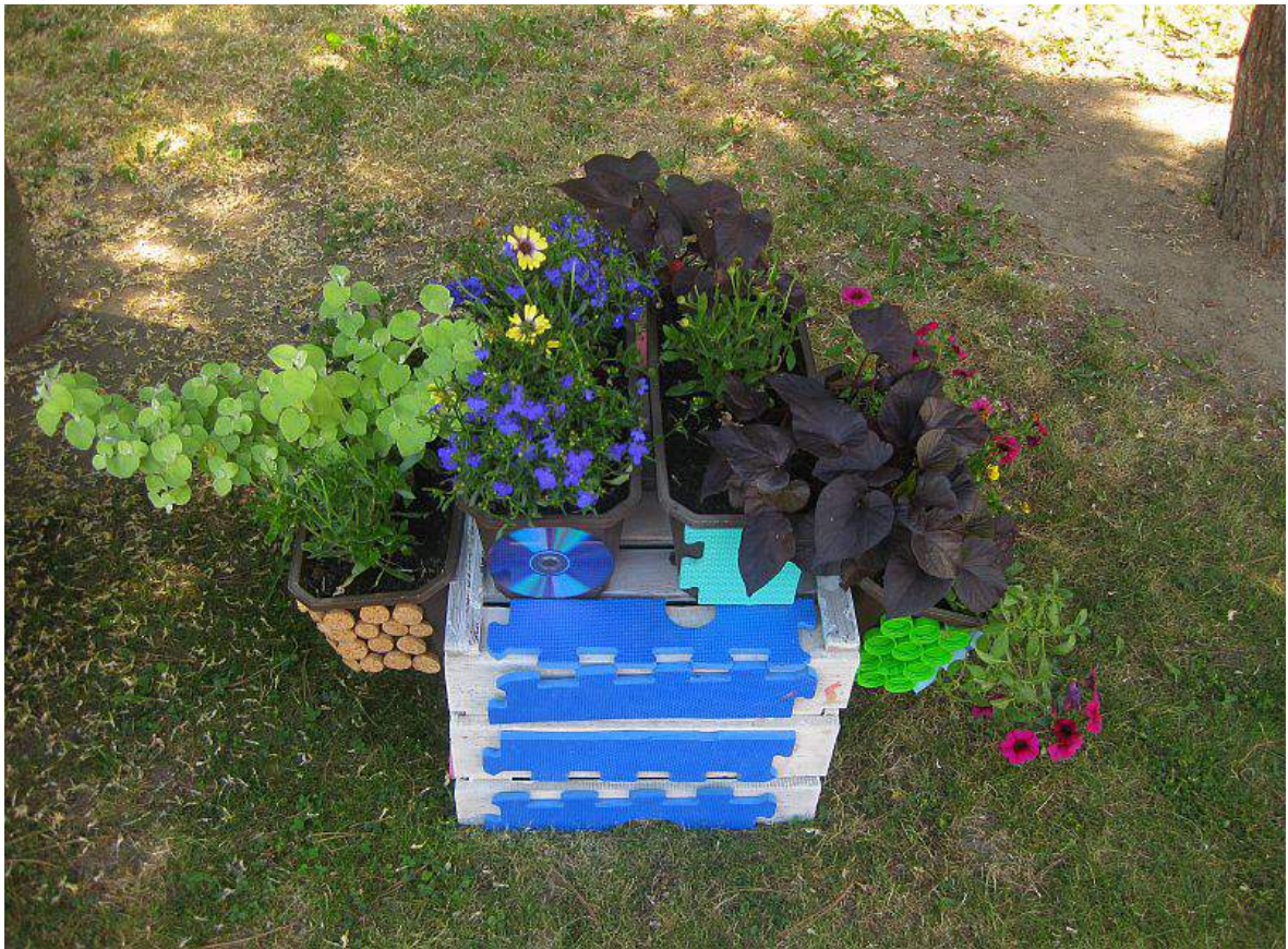
„Skrzynia z kwiatami”- zmysł wzroku i węchu