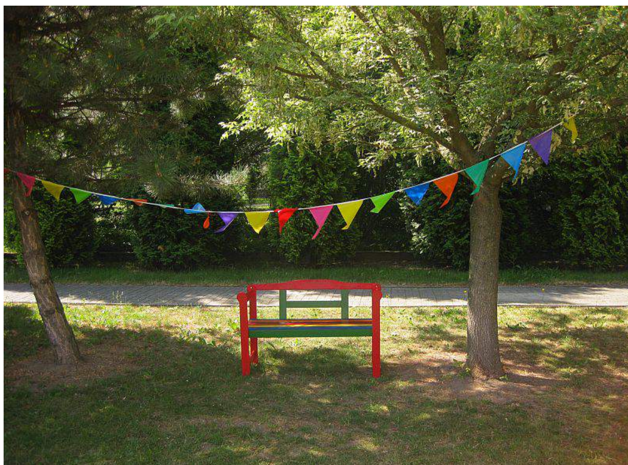
„Ławeczka dla przedszkolnych przyjaciół” -relaksacja