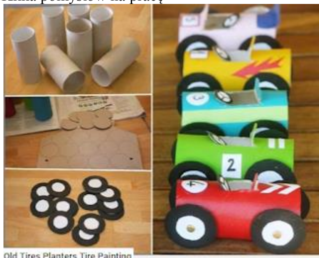
Old Tires Planters Tire Painting