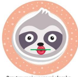
Przytrzymaj wargami słomkę.