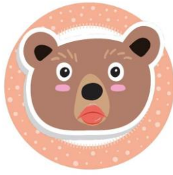
Zrób smutną minę.