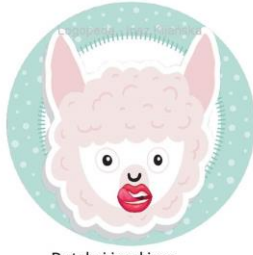
Dotykaj językiem kącików ust.