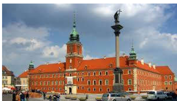
Zamek Królewski z Kolumną Zygmunta