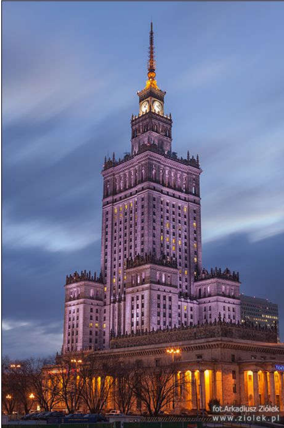
Pałac Kultury i Nauki