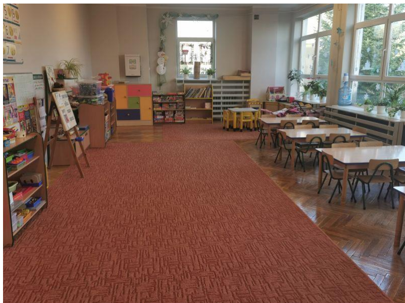
zdjęcie sali grupy V