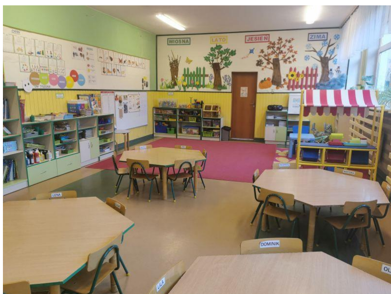
zdjęcie sali grupy VI