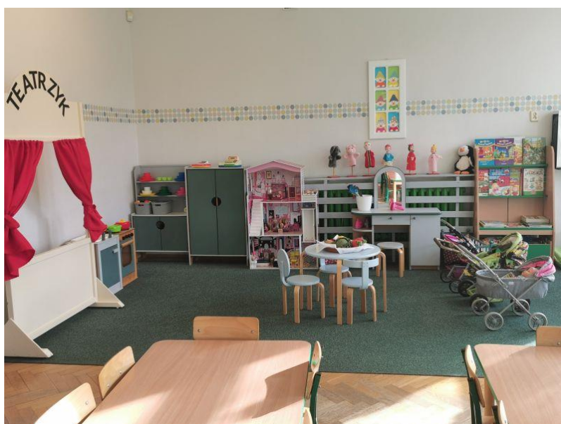
zdjęcie kącika lalek w sali grupy II