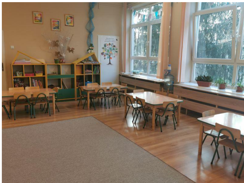
zdjęcie sali grupy IV