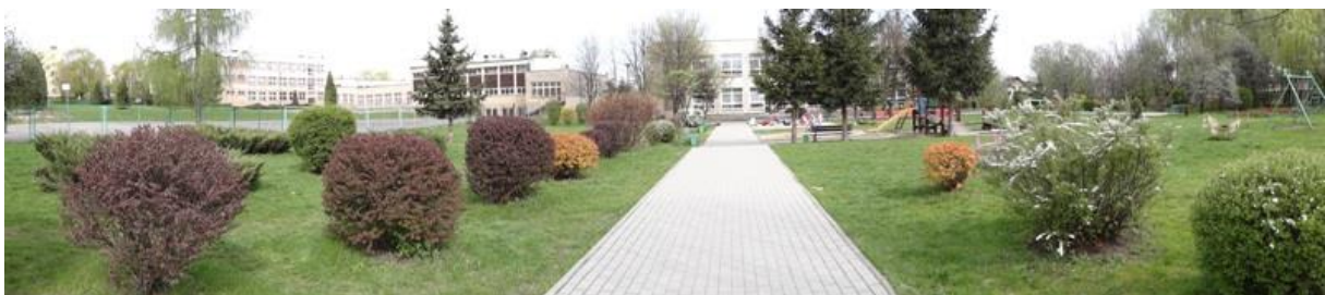
Zdjęcie budynku z tyłu (od ogrodu)