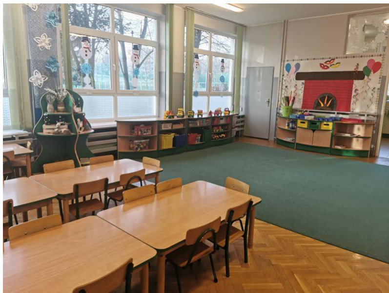
zdjęcie sali grupy II