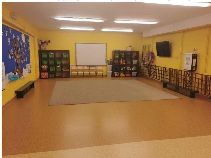
zdjęcie sali do zajęć rytmiczno-gimnastycznych

1. sala do zajęć rytmicznych i gimnastycznych