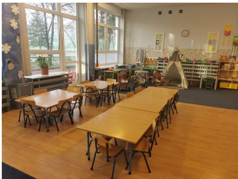
zdjęcie sali grupy I