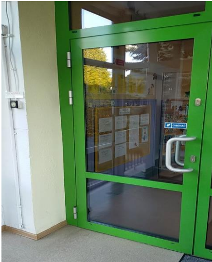
zdjęcie zielonych drzwi

Zobaczysz zielone drzwi, przy których jest dzwonek.