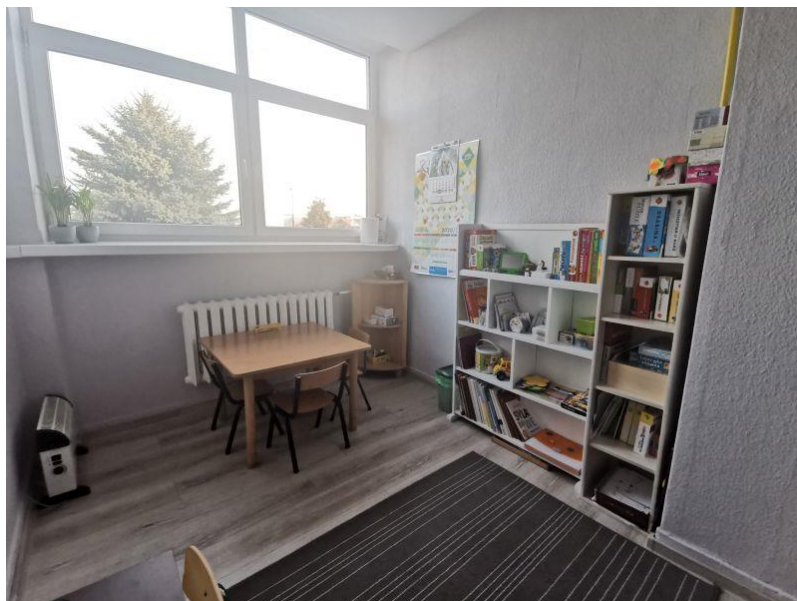
zdjęcie gabinetu logopedy