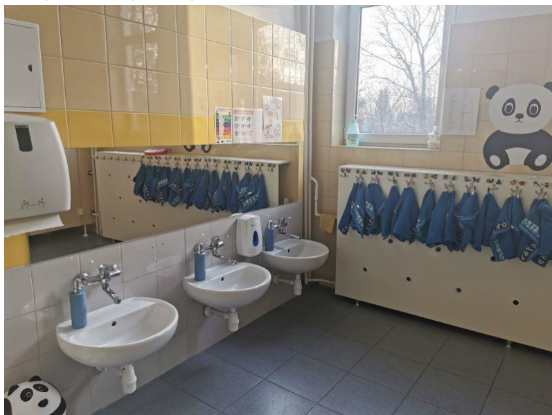
zdjęcie łazienki grupy I

Przy każdej sali jest dostęp do łazienki dla dzieci.