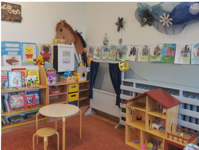
zdjęcie kącika czytelniczego na sali grupy III