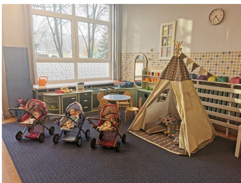
zdjęcie kącika lalek w sali grupy I