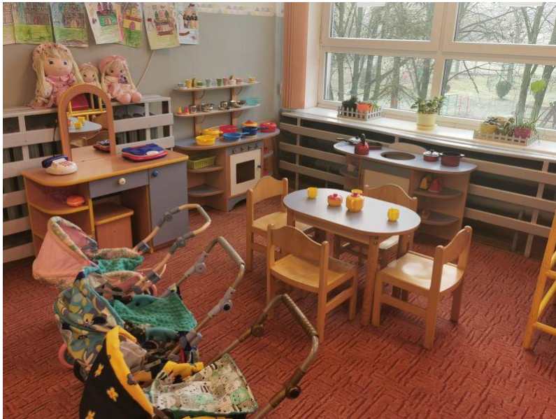
zdjęcie kącika lalek w sali grupy III