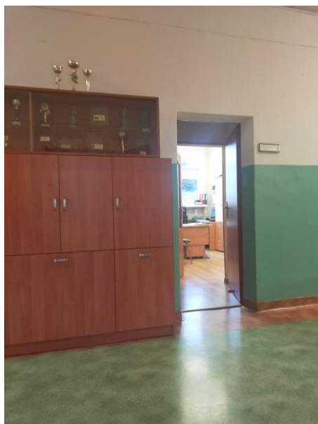
Zdjęcie drzwi do sekretariatu.

Drzwi do sekretariatu znajdują się obok szafy z pucharami. Przy drzwiach znajduje się tabliczka informacyjna.