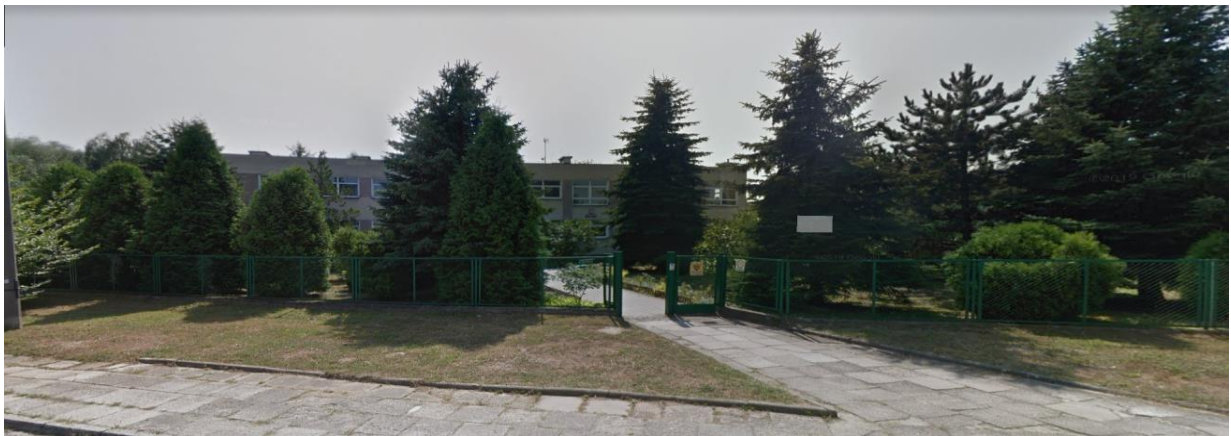
Zdjęcie wejścia na teren przedszkola

Ma parter i jedno piętro. Otacza go duży ogród.