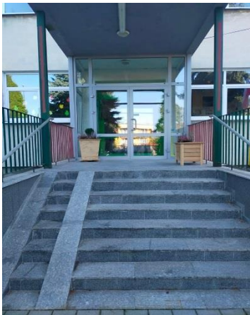
zdjęcie wejścia głównego

Wchodzisz wejściem głównym – białe drzwi.