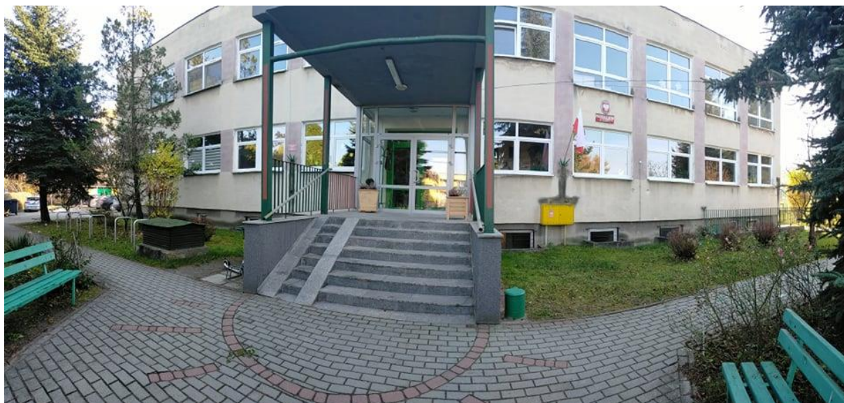
Zdjęcie wejścia głównego

Osoba niepełnosprawna ruchowo, poruszająca się na wózku inwalidzkim nie może samodzielnie dostać się do budynku.