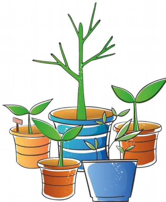
4. plants - rośliny