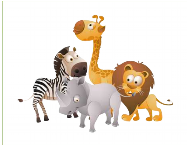
3. animals - zwierzęta