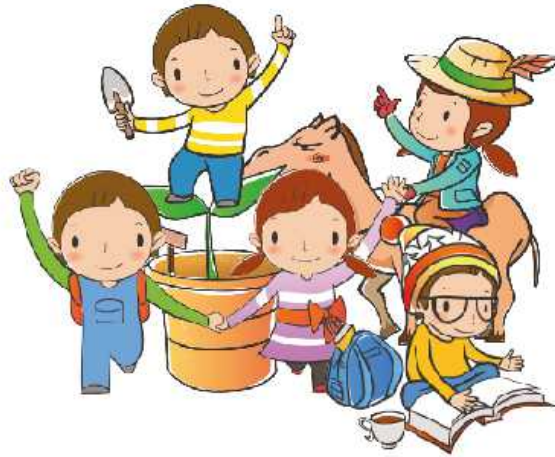
2. people - ludzie